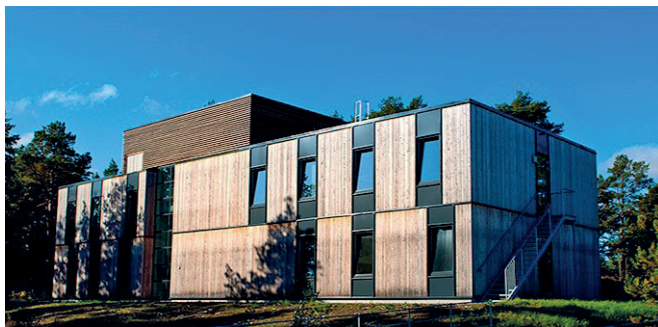
Fot. 1. Dom przejściowy w Halden