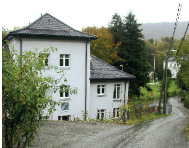
Fot. 7. Dom przejściowy w Lyderhorn