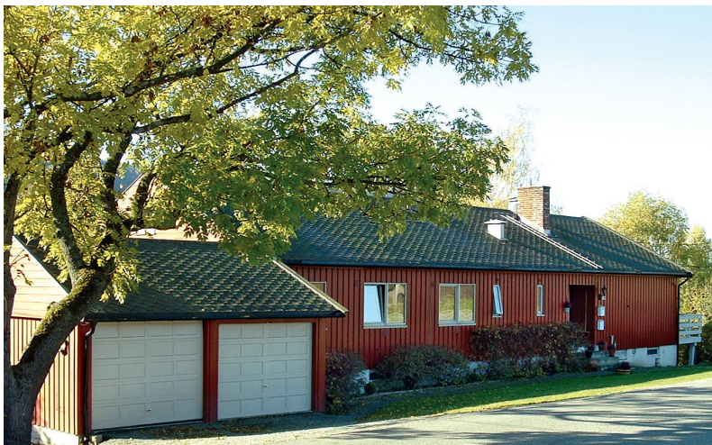
Fot. 3. Dom przejściowy w Buskerud