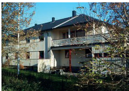
Fot. 4. Dom przejściowy w Bodø