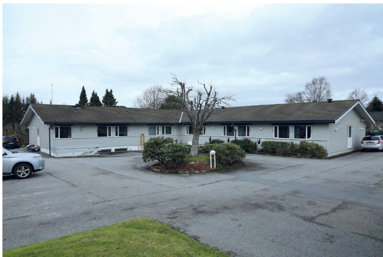
Fot. 2. Dom przejściowy w Auklend