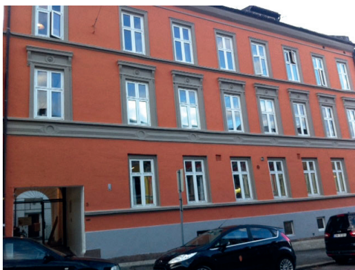
Fot. 8. Dom przejściowy w Oslo