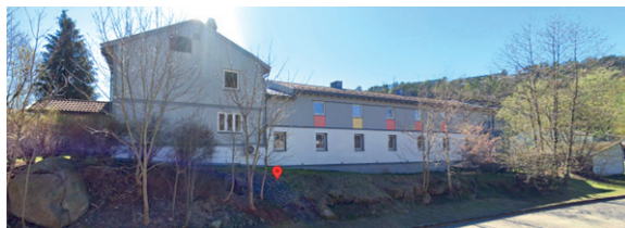
Fot. 5. Dom przejściowy w Solholmen