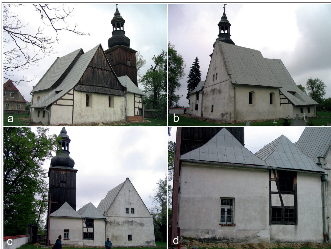
Pelczyn, gm. Wołów. Kościół pw. św. Teresy od Dzieciątka Jezus. Badania archeologiczno-architektoniczne w 2005 r. Widok: a) od SE; b) od SW; c) od W; d) od W na kaplicę i poszerzenie korpusu nawowego

W późniejszej fazie budowlanej na opisanych ławach zbudowano nowe ściany, o konstrukcji zapewne szkieletowej, obecnie otynkowane. Do ich wzniesienia użyto cegieł maszynowych na twardej zaprawie wapienno-cementowej barwy