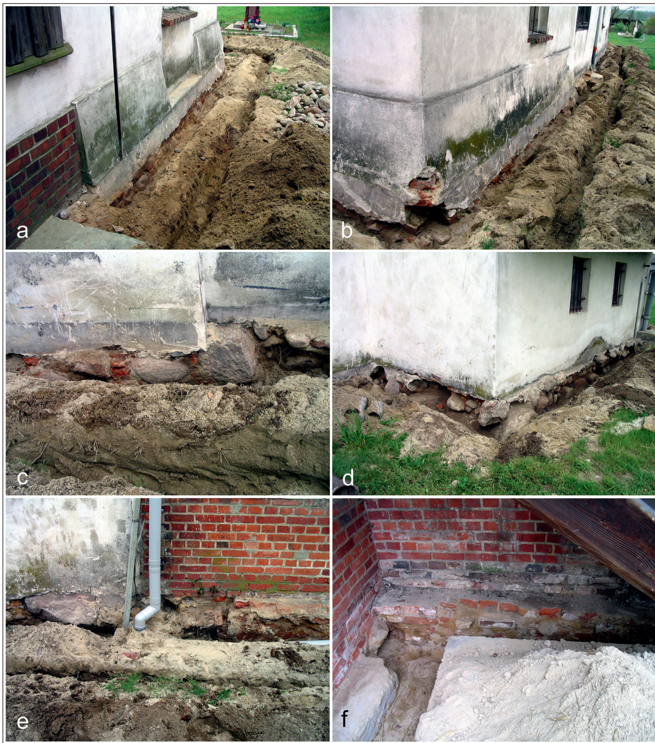
Pełczyn, gm. Wołów. Kościół pw. św. Teresy od Dzieciątka Jezus. Badania archeologiczno-architektoniczne w 2005 r. Wykop instalacyjny: a) st. 10; b) st. 10 i 9; c) st. 9 i 8; d) st. 5; e) st. 4 i 3; f) st. 2 i 1

W wykopie zarejestrowano ławę fundamentową zachodniej ściany poszerzenia korpusu nawowego pierwotnej świątyni. Powstała ona na styk do zachodniej ściany korpusu po uprzednim rozebraniu jego ściany północnej. Również