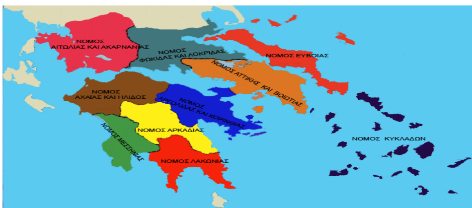
Mapa 3. Podział terytorium Królestwa Grecji na nomarchie

Podczas regencji, dnia 12 października 1833 r., wprowadzono rząd, na czele którego stanął A. Mavrokordatos. Już w pierwszych miesiącach funkcjonowania nowo utworzonego rządu podsunęto pomysł dokonania nowego podziału administracyjnego w Królestwie Grecji. Podział ten został dokonany na podstawie dekretu króla z dnia 15 kwietnia 1833 r. w sprawie podziału Królestwa i jego administracji.