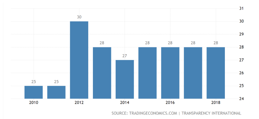
Wykres 1. Poziom korupcji w Libanie

Lebanon Corruption Index, [dostęp: 5.01.2019], https://tradingeconomics.com/lebanon/corruption-index?user=btrader .