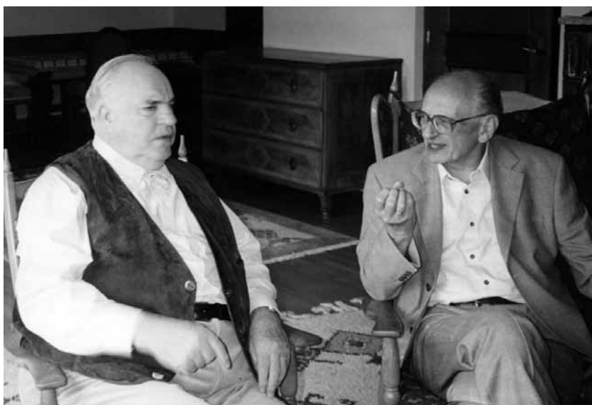
Władysław Bartoszewski w prywatnej rozmowie z Helmutem Kohlem podczas urlopu letniego. St. Gilgen, 18 sierpnia 1999 r. (Salzkammergut, Austria).

Zdjęcie z archiwum rodzinnego W. Bartoszewskiego.