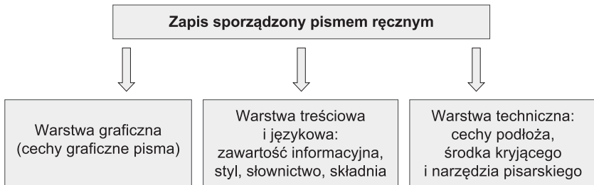
Rys. 2. Warstwy zapisu podlegające badaniom pismoznawczym 8